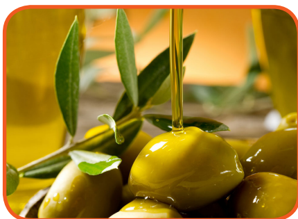
روغن زیتون برای سلامت قلب و عروق مفید است

➤ انواع روغن زیتون از لحاظ ترکیبات با یکدیگر متفاوت است؛ به طوری که ارزش تغذیه‌ای روغن زیتون بکر (تصفیه نشده) از روغن زیتون مخلوط و روغن زیتون تصفیه‌شده بیشتر است.